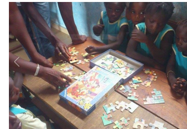
Juli 2014: een school met materiaal